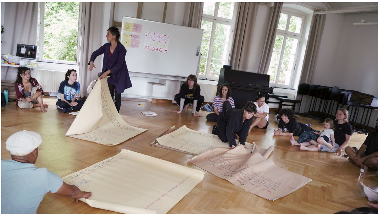
Ideenentwicklung bei der internationalen Begegnung #RRXP25 in Heek-Nienborg