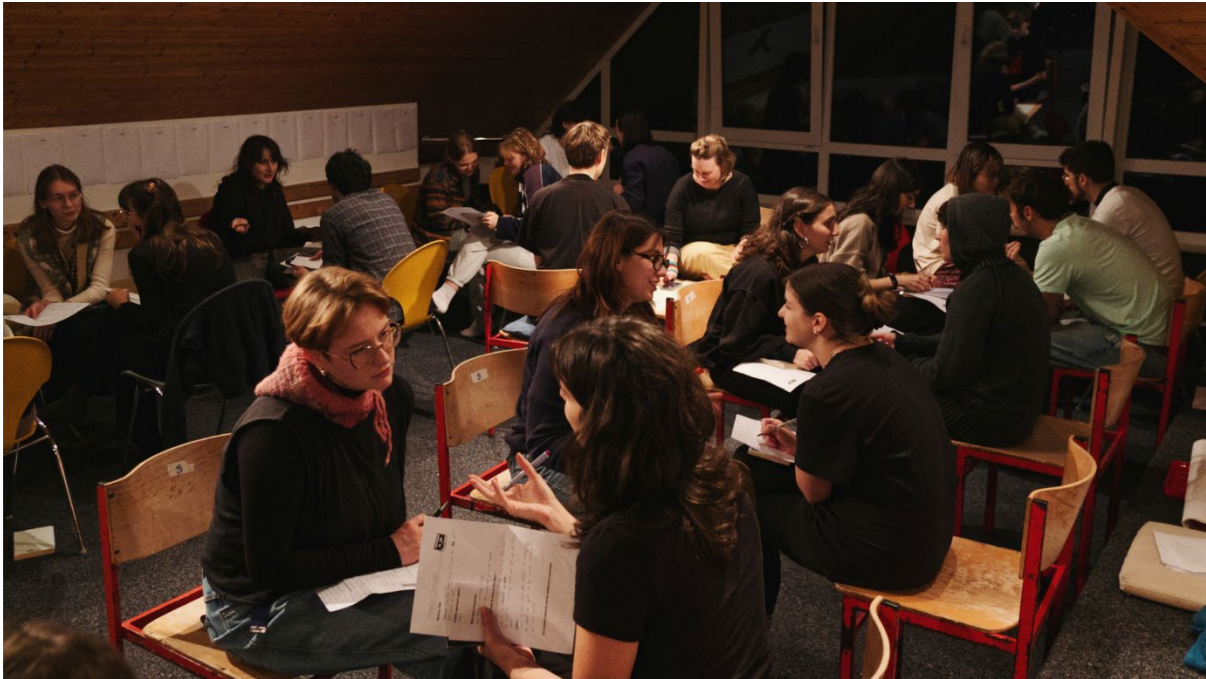
Kreativer Austausch in der „Concept Café“-Ideenbörse

In der Zeit vom 14. bis zum 16. November wurden dann — neben weiterlaufender Arbeit in künstlerischen Disziplinen an den Vormittagen — international gemischte Kreativgruppen gebildet, die sich durch gemeinsame Interessen an Teilaspekten des Gesamthemas zusammenfanden. Nachdem Ideen in Form eines „Concept Café“ (eine Art „künstlerisches Speeddating“) ausgetauscht worden waren, entstanden Themencluster, die dann ihre Ideen zu Produktionsplänen ausarbeiteten und dabei vom künstlerischen Team und einer professionellen Theaterautorin beraten wurden. Dazu kamen Gruppenaktivitäten wie die strukturierte Gruppenimprovisationsmethode „Mangrovia“ und eine Gruppenkochaktion.