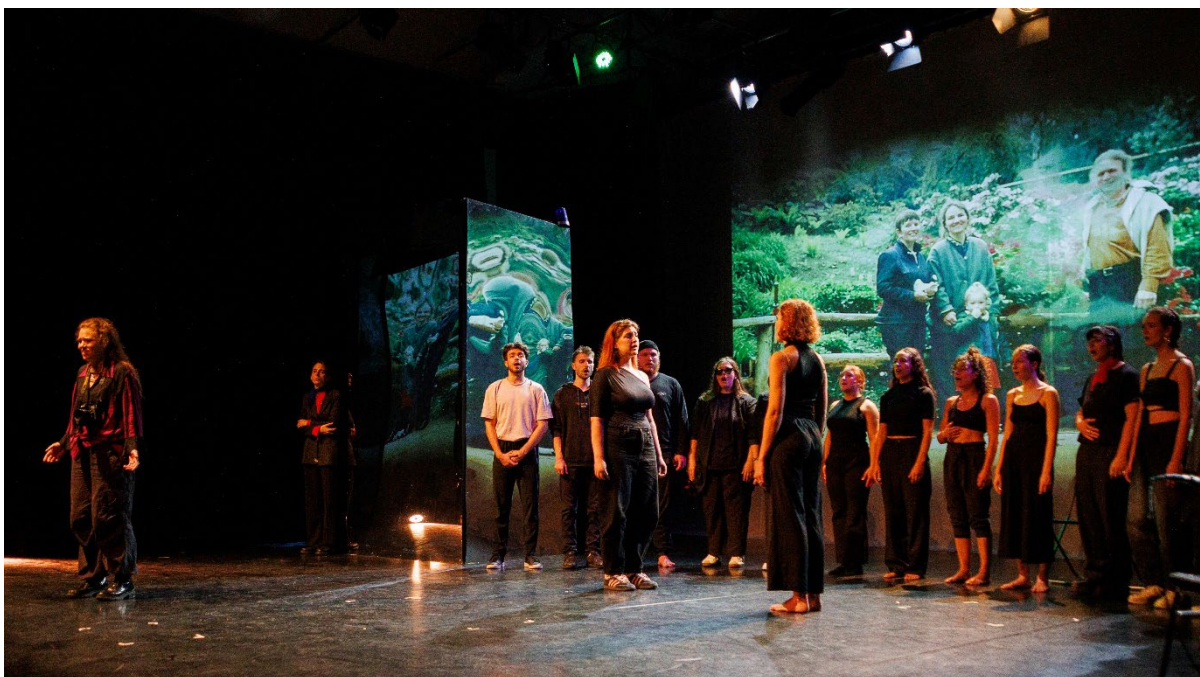
Aufführung RXP25 in der Alten Feuerwache Köln

Sekundäre Zielgruppe des Projekts war ein jugendliches und allgemeines Publikum im Großraum Köln und weltweit, das die gemeinsam erarbeiteten Ergebnisse der Teilnehmenden bei den Aufführungen in Köln sowie anschließend online erleben konnte.