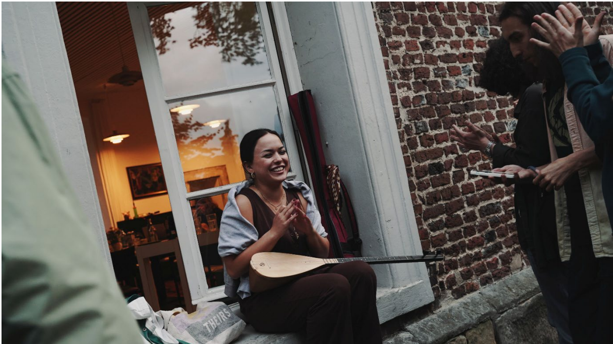
Internationale Begegnung „The ROOTS & ROUTES Experience 2025“ in Heek-Nienborg

RRCGN hat 2025 über 450.000 Views bei Instagram erreicht, dazu noch etliche auf unserem Youtube-Kanal und unseren Facebook-Pages.