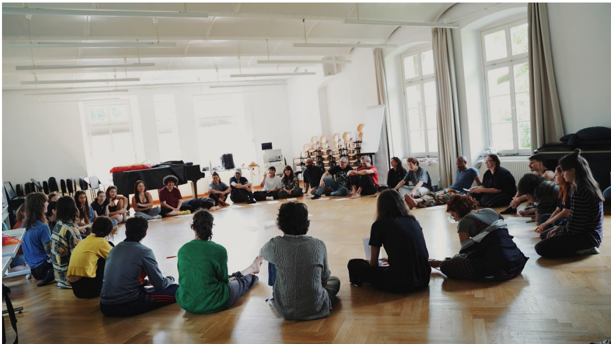
RRXP25-Gruppentreffen in Räumen der Landesmusikakademie NRW Heek