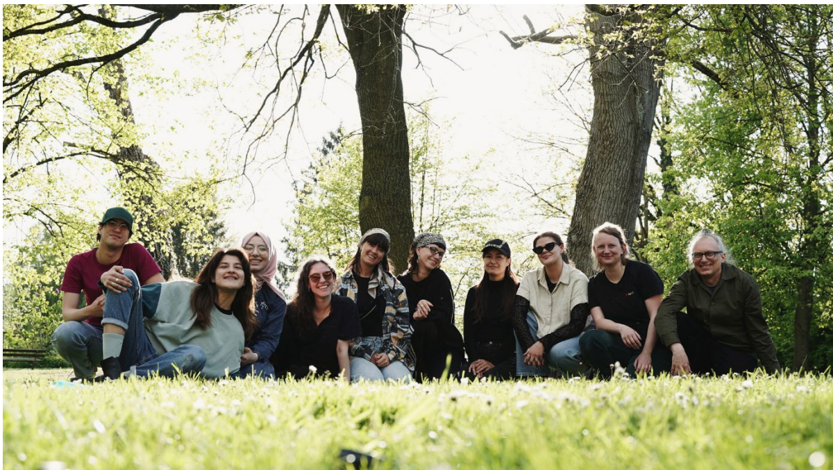
LevelUp Academy Ostern 2025 in Heek-Nienborg

Natürlich segeln Förderanträge gerade in Bereichen, wo es um Beträge über 20.000 € und signifikante Personalkosten geht, immer in harter Konkurrenz, und Erfolg hier ist stets auch Glückssache. Unser Team ist seit 2001 in der projektgeförderten Jugendarbeit unterwegs und hat mittlerweile erfolgreich eine dreistellige Anzahl von Projekten beantragt, darunter sehr viele kleine, aber auch einige große europäische in unterschiedlichen Förderprogrammen und große lokale bei unterschiedlichen Stiftungen, Landes- und Bundesprogrammen. Eine derartige Ansammlung von Misserfolgen ist uns in diesen 25 Jahren noch nicht begegnet — und wir sind uns noch nicht sicher, ob das an verstärkter Konkurrenz durch bundesweite Mittelkürzungen im Kultur- und Sozialbereich liegt, an einem generellen Rückgang der Förderung für Diversitätsprojekte, oder daran, dass iJuLa zu erfolgreich war (u.a. dreifach mit bundes- bzw. landesweiten Preisen ausgezeichnet, viel Presse, Besuch des Bundes-Queerbeauftragten) und damit ein Folgeprojekt zu sehr in dessen Schatten vermutet wurde.