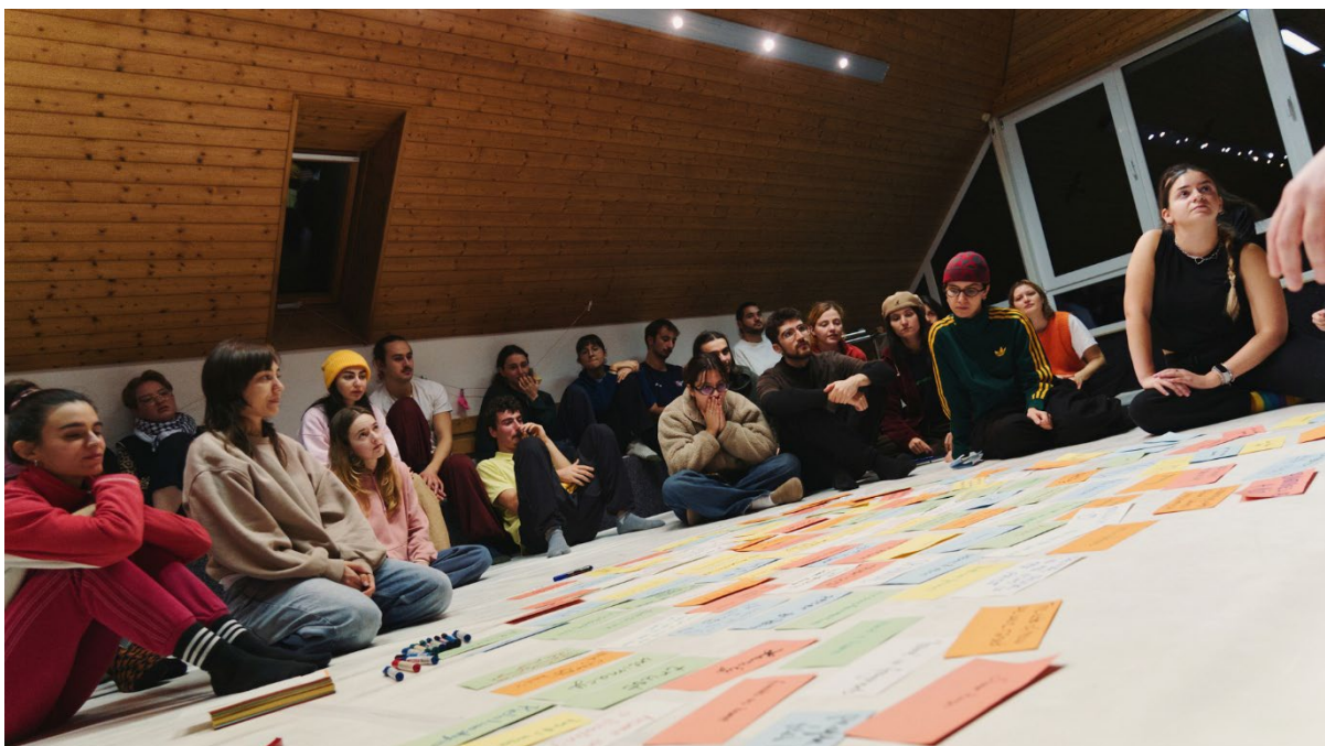
Gruppenarbeit bei der internationalen Begegnung „Echoes of the Past“ auf Baltrum

Im zwölften Jahr des Vereinsbestehens musste RRCGN sich so erneut massiv umstrukturieren; das Vereinsteam schrumpfte, der vormalige iJuLa-Raum wurde zum ROOTS & ROUTES Space, an die Stelle der 5 überwiegend größeren Projekte im Jahr 2024 traten 2025 nun 10 eher kleinere. Mit der bereits Mitte 2024 erfolgten Akkreditierung im Freiwilligenprogramm des Europäischen Solidaritätskorps konnten wir ab März 2025 erstmals eine Volontärin im Europäischen Freiwilligenjahr aufnehmen. Zu den positiven Entwicklungen des Jahres gehörte auch die Findung neuer internationaler Partnerorganisationen beim internationalen Seminar #CABY25 in Budapest; mit Mesto žensk (City of Women)/Ljubljana, Confetti Studio und Calàm/Sant Boi de Llobregat bei Barcelona, La Zentralita/Sevilla und Visual Voices/Nikosia entsendeten fünf neue Partner Teilnehmende zu 2025 von RRCGN gehosteten bzw. koordinierten Jugendbegegnungen.