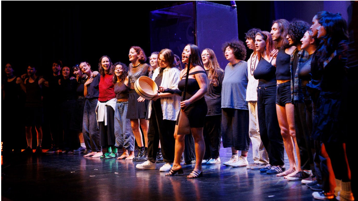
Finale der RXP25-Premiere in der Alten Feuerwache Köln

Hier noch einige Zitate aus den Antworten zu offenen Fragen: