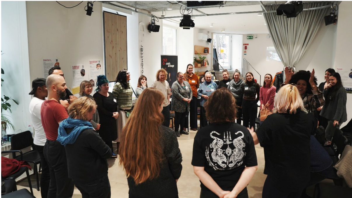
Internationales Fachkräfteseminar #CABY25 in Budapest

#CABY bot den Vertreter*innen der beteiligten Organisationen Raum für Austausch und Ideenentwicklung für potenzielle zukünftige Projekte; hier wurde auch das Konzept für das weiter unten beschriebene ReStory-Projekt finalisiert.