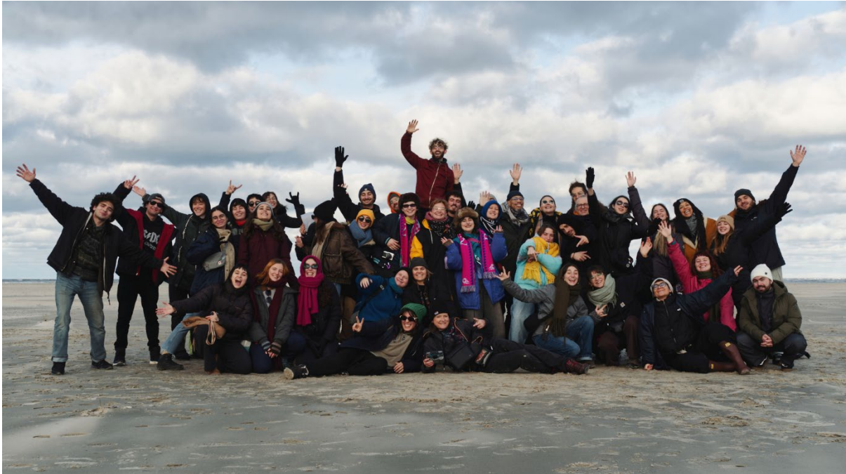
Gruppenfoto von der internationalen Begegnung „Echoes of the Past“ 2025