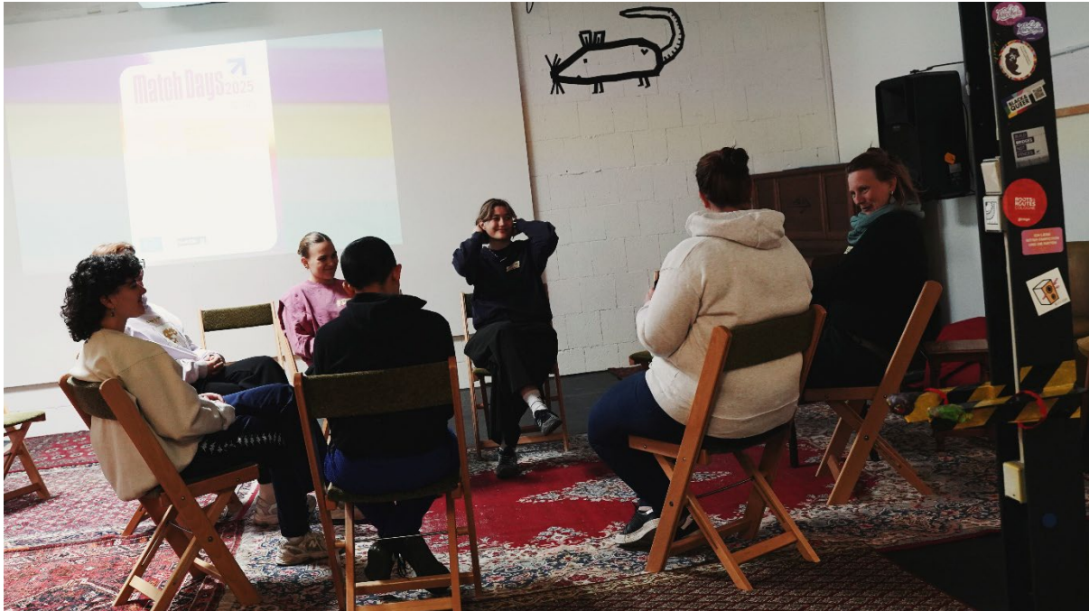
Workshop bei den ROOTS & ROUTES Match Days 2025

Es gab Workshops in den künstlerischen Disziplinen Tanz, Musik, Theater und Medien; Musik und Medien wurden an beiden Tagen angeboten, während Theater nur am ersten und Tanz nur am zweiten Tag stattfand. Zusätzlich gab es eine Kennenlernrunde und eine Vorstellung der drei anstehenden internationalen Begegnungen.