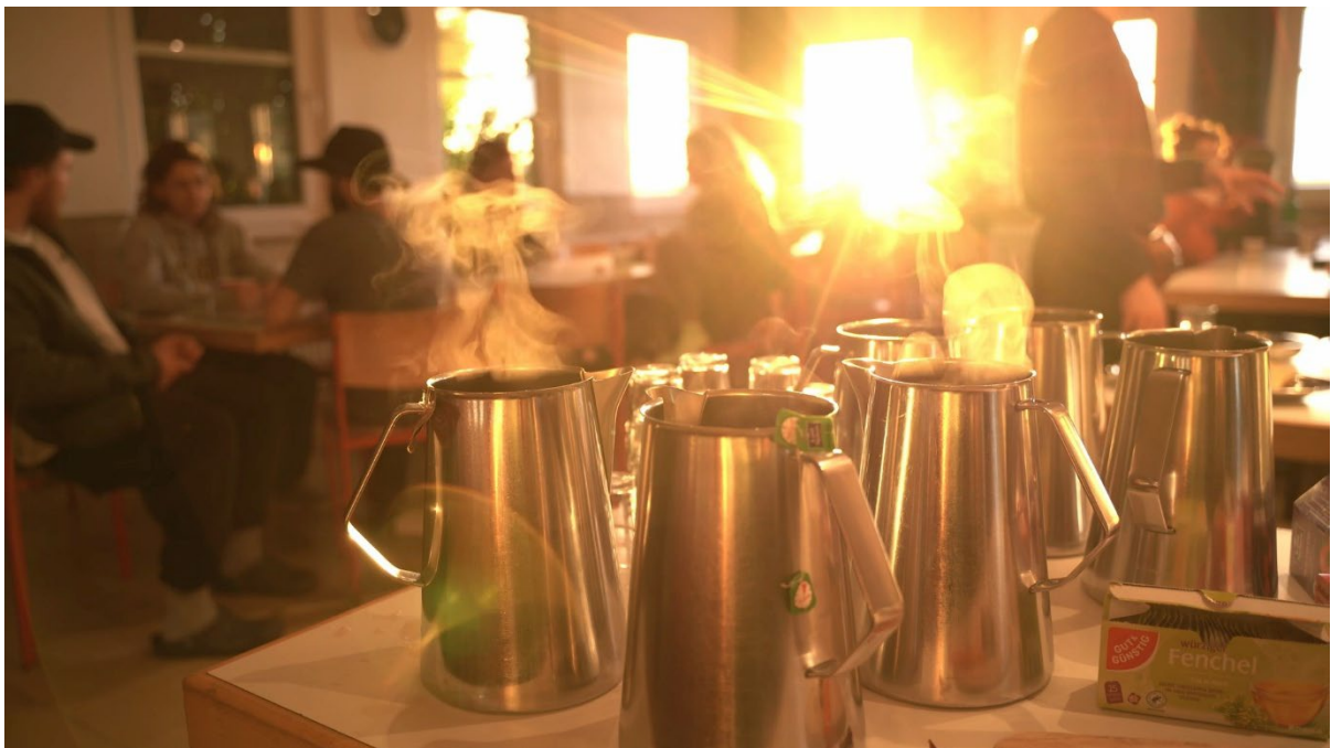
Internationale Begegnung „Echoes of the Past 2025“, Baltrum