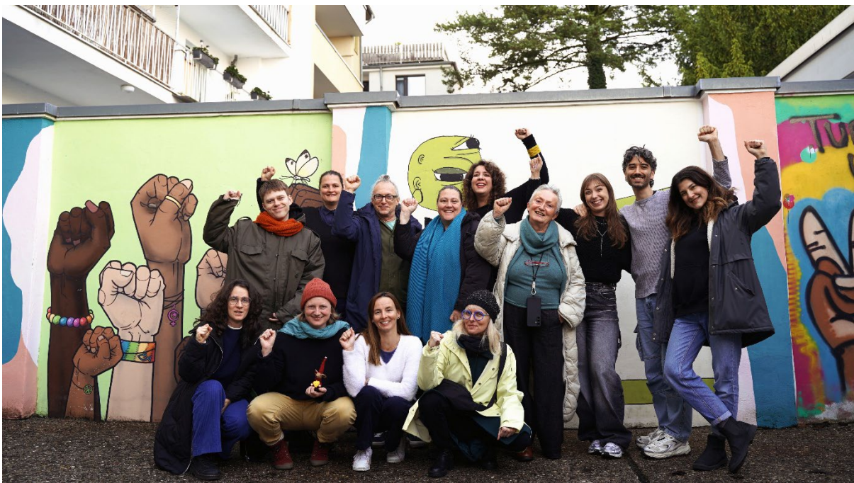
Internationales ReStory-Partnertreffen vorm ROOTS & ROUTES Space

Vom 6. bis zum 10. Dezember war RRCGN Gastgeber des ersten internationalen Partnertreffens (Methodology Development Meeting #1) in unserem ROOTS & ROUTES Space in der Herthastraße 50.