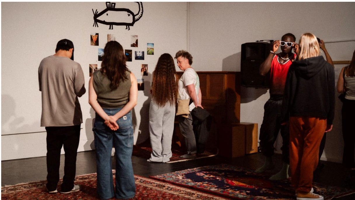
„The Migrated Body“-Präsentation im ROOTS & ROUTES Space

Das RRCGN-Team berät Fachkräfte aus Jugend- und Kulturarbeit in Köln bei der Entwicklung und Beantragung internationaler Projekte, und vermittelt Netzwerkkontakte in andere Länder und in einige der Kölner Partnerstädte (Barcelona, Istanbul, Lille, Stockholm).