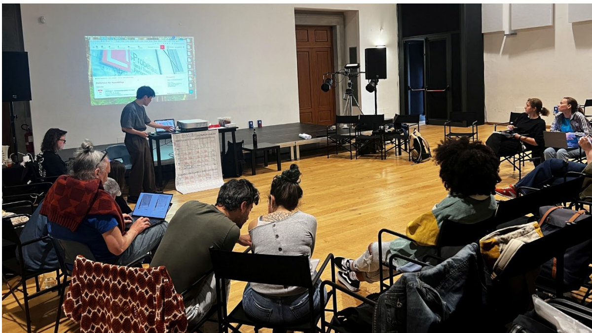
Präsentation der Salzburger Academy-Planungen beim Partnertreffen in Florenz

RRPCA 2.0 wird als Strategische Partnerschaft im Jugendbereich vom EU-Programm Erasmus+ gefördert; zusätzliche Förderung für die Aktivitäten in Deutschland kommt von der Kurt und Maria Dohle Stiftung. RRCGN koordiniert das Projekt, internationale Partner sind das Streetdance Center Salzburg/AT, SMouTh Larissa/GR, Centro di Creazione e Cultura Florenz/IT, Empreinte Lille/FR, KITKC Kaunas/LT und die Subjective Values Foundation Budapest/HU.