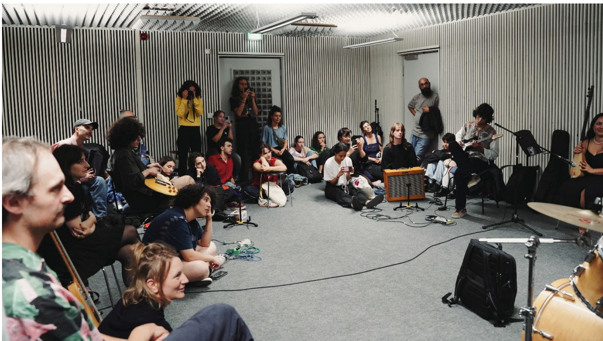
Zwischenpräsentation des Musikworkshops während #RRXP25

Seit Vereinsgründung im Dezember 2013 hat RRCGN Fördermittel im Umfang von rund 3,5 Millionen Euro für Projektaktivitäten mit starkem Kölnbezug akquiriert (ohne an internationale Projektpartner z.B. in Kölner Partnerstädten weitergeleitete Mittel; ohne Fördermittel der Stadt Köln).