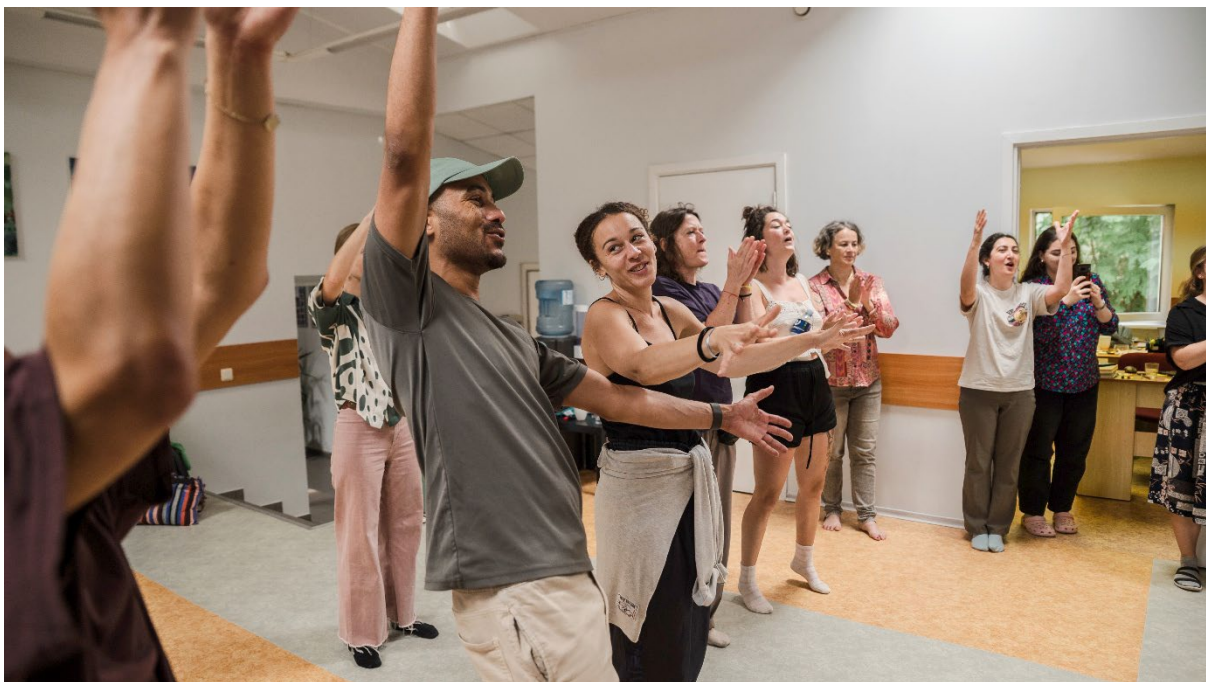
Praktischer Methodenaustausch beim EOTO25-Seminar