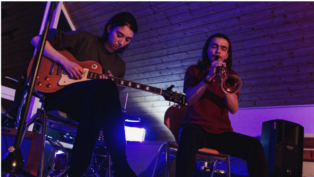
Teilnehmende aus Istanbul und Florenz beim Musikworkshop auf Baltrum

Die primäre Zielgruppe des Projekts waren Jugendliche und junge Erwachsene (18-26 Jahre) aus Köln und aus den Partnerländern Frankreich (Lille), Italien (Florenz), Griechenland (Larissa), Türkei (Istanbul) und Spanien (Barcelona, Sant Boi de Llobregat, Sevilla); mit künstlerischem Talent und Vorerfahrungen im Bereich der darstellenden Künste oder Medien und mit unterschiedlichen sozialen/kulturellen Hintergründen. Das Projekt richtete sich insbesondere an junge Menschen mit erschwertem Zugang zu formalen oder kostenpflichtigen Angeboten kultureller Bildung, an Jugendliche mit Migrationshintergrund, an Geflüchtete und an Angehörige von Minderheiten in ihren jeweiligen Wohnländern. Das Projekt bot den Teilnehmern non-formale kulturelle Bildung, internationalen Austausch, Vernetzungsmöglichkeiten und künstlerische Professionalisierung.