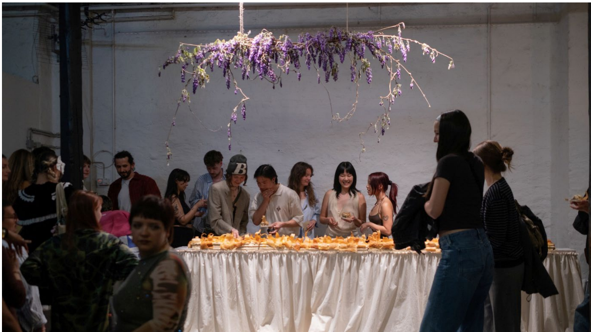
oc:cura-Event im Atelierzentrum Ehrenfeld