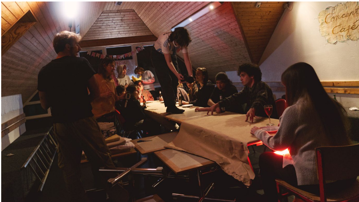
Dreharbeiten bei der internationalen Begegnung „Echoes of the Past“

Vom 8. bis zum 24. November 2025 fand die internationale Begegnung „Echoes of the Past — what we keep, what we let go“ auf der Nordseeinsel Baltrum und in Köln statt. 42 junge Künstler*innen aus 6 europäischen Ländern trafen sich auf der autofreien Nordseeinsel Baltrum in einem Selbstversorgungshaus.