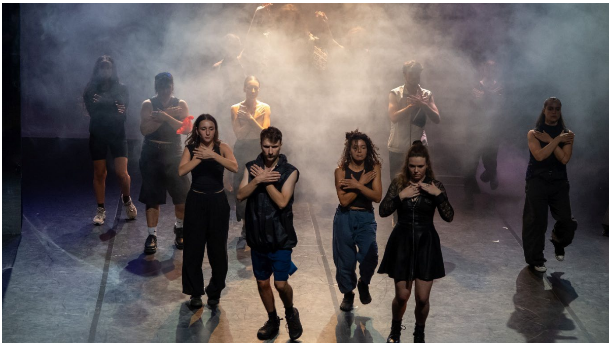
Aufführung der internationalen Begegnung #RRXP25 in der Alten Feuerwache Köln

Besonders das erste Halbjahr stellte den Verein vor große Herausforderungen; die angemieteten Räumlichkeiten in der Herthastraße konnten nur unter Einsatz der Vereinsrücklagen gehalten werden, welche dadurch etwa um die Hälfte schrumpften. Ab Jahresmitte konnte die Miete wieder gestückelt über verschiedene Projekte und sonstige Vereinseinnahmen bezahlt werden.